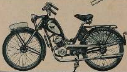
WANDERER - Motorfahrrad Modell 12 A5