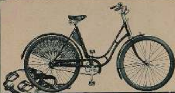
Ein stabiles WANDERER-Tourenrad