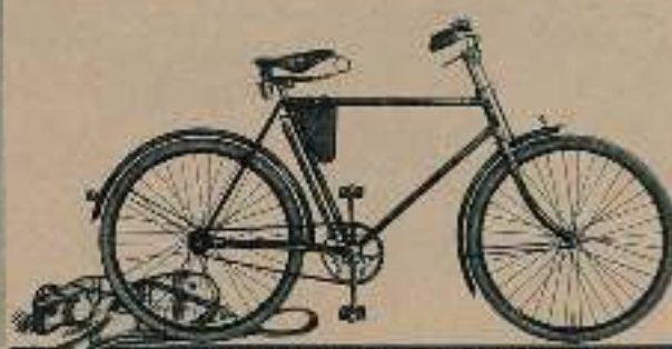
Das Rad für den Anspruchsvollen