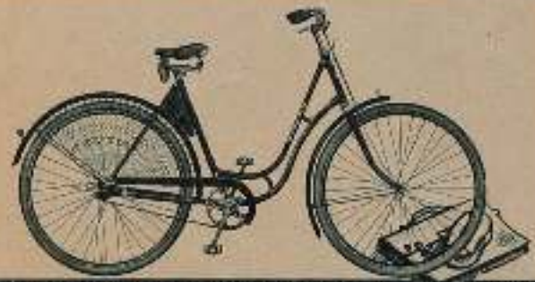
Ein elegantes Rad für die Fahrt zur Arbeitsstätte

Die WANDERER-Modelle 30 und 32 sind besonders beliebt, weil sie gut aussehen, leicht laufen, dabei jedoch nicht viel kosten. Mit vernickelten und verchromten Blankteilen, Komet-Freilaufnabe und 1,70" Wulstreifen ist das Herren-Fahrrad für RM 65,80 erhältlich, das Damen-Fahrrad für RM