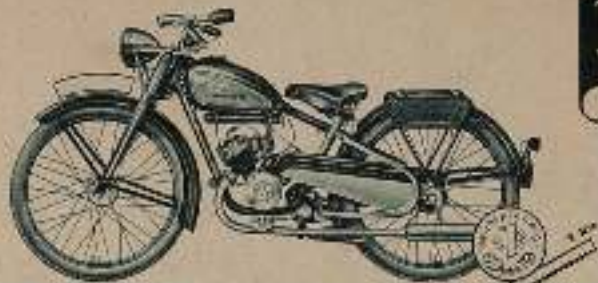
WANDERER - Sportmotorfahrrad Modell 1 Sp