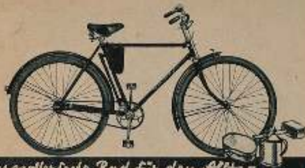
Das wetterfeste Rad für den Alltag

Das Modell WANDERER 40 hat durch die Verwendung der Wanderer-Klemm-Muffen einen außergewöhnlich stabilen Rahmen. Außerdem ist es wetterfest, da alle Metallteile emailliert sind, der Rahmen schwarz, die blanken Teile silberfarbig. Preis: mit Komet-Freilaufnabe und 1,70" Wulstreifen Damenrad RM 68,-