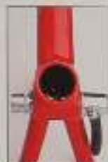
Die neue, patentierte Sattelstütze-Fixierung von Kettler