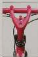
Speziell mit wickelbarer Zweifinger-Vulka