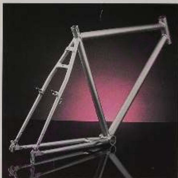
Das fertige Kugelgestrahlte Kettler Alu-Rahmen.

Belastungen hervorragende Festigkeiten auf. Kettler Alu-Räder sind ohne Zweifel Fahrräder der Spitzenklasse. Das macht uns so leicht keiner nach.