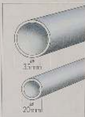
Over-sized Tubes: Alu-Rohr »P2000« im Vergleich zu herkömmlichen Stahlrohren im Fahrradbau.

Speziell im Bereich des Radsports werden an die Rahmenkonstruktionen enorm hohe Ansprüche gestellt. Als eigentlicher »Körper« des Rades werden sie in puncto Verwindungssteifigkeit, Sicherheit und nicht zuletzt Haltbarkeit extremen Belastungen ausgesetzt. Alle Kettler Fahrräder besitzen Rahmen aus Aluminium. Ihre Qualität und Verarbeitung wurde in den vergangenen Jahren durch namhafte europäische Testinstitute