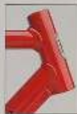
Die neue Rahmenverstärkung für alle Herren-Mountain Bikes und Sporträder

21-Gang-SIS-Schaltung, neue Rahmenverstärkung, Sattelstütze-Fixierung, komplette Straßenausstattung, Cantilever-Bremse vorne, U-Brake hinten, Schaltwerksschutz, Rahmenhöhe Herren: 55cm / 58cm, Rahmenhöhe Damen: 50cm, Farbkombination: Indischrot/diamantschwarz DM 1259,-*