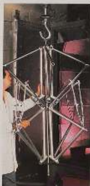
Die geschweißte Rahmen in der Kugelstrahl-Anlage.

besonders bewertet. Noch kein Hersteller erzielte bessere Noten für seine Fahrräder. Kettler: Qualität made in Germany. Auf computer-gesteuerten Fertigungsautomaten fertigt Kettler die muffenlosen Alu-Rahmen. So entstehen High-Tech-Produkte, die auch extremen Belastungen standhalten. Kettler Alu-Rahmen sind verwindungssteif, leicht und absolut rostfrei; veredelt mit einer epoxy-