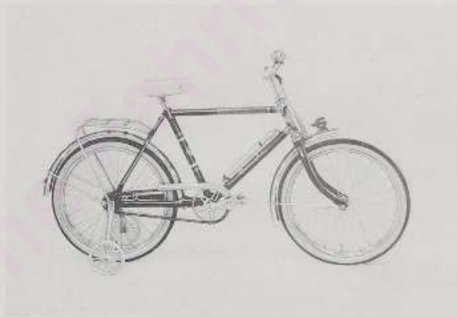
Modell 513: Kniebrennrad 20"